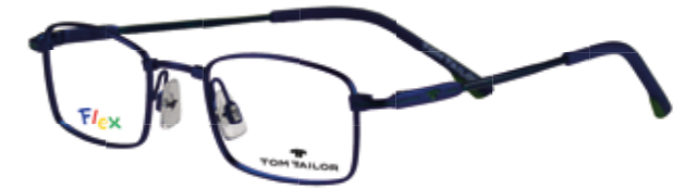
TOM TAILOR Kinderbrille